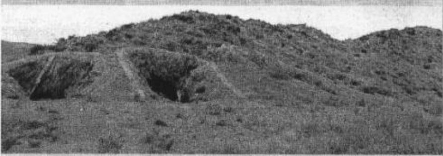
HIPOGEOS. En Villaricos se hallan este tipo de yacimientos.

Cultura tiene previstos convenios para varios centros de interpretación