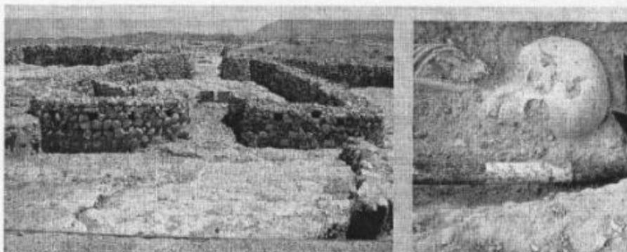
RESTOS. En la provincia se encuentran numerosos yacimientos de gran interés cultural.

Además desde Cultura ya están trabajando en la puesta en marcha de otros convenios con el