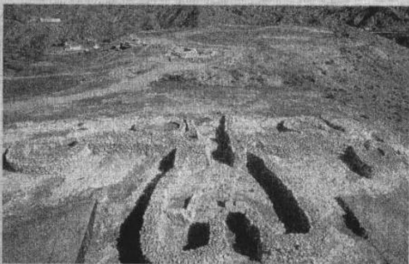
LOS MILLARES. Se puede visitar y está protegido de espolios.

Por su parte la ley de Patrimonio Histórico de Andalucía, considera faltas muy graves, entre otras, la destrucción de restos arqueológicos y paleontológicos inscritos en el Catálogo General del Patrimonio Histórico, así como la destrucción de yacimientos inscritos en el mismo que suponga una pérdida de información irreparable.