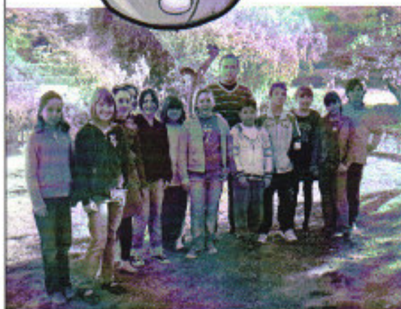
Componentes del periódico "Noticias a bordo"

Esta idea surge de los propios intereses de los niños/as, con gran ilusión hemos creado este periódico, esperando que prosiga muchos años más.