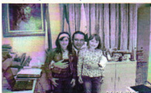
Nuestras reporteras en el despacho del Alcalde.

-¿En qué año se hará el colegio? Pues, realmente el colegio es una cosa que me preocupa mucho, por mí empezaría mañana. Pero necesitaría la ayuda de todo el pueblo, durante el 2010 como deseo.