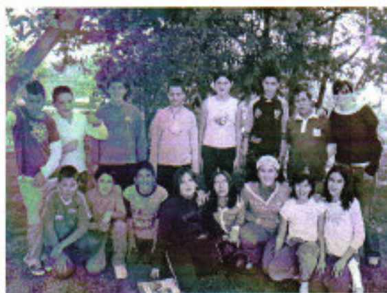
Alumnos y alumnas de sexto curso