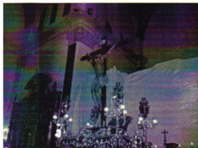
Nuestro Cristo de la Luz

También han puesto una tienda en la oficina de información del Ayuntamiento de Dalías, donde se están vendiendo recuerdos del Cristo de la Luz.