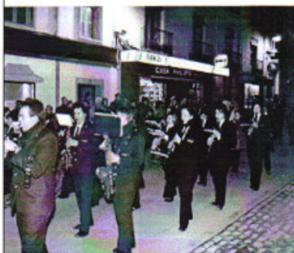
Banda de música de Dalías