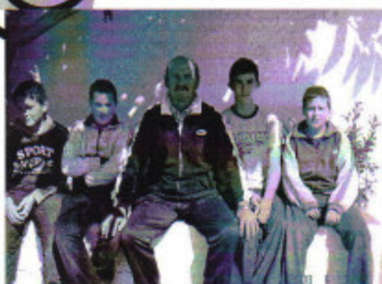
Miembros del equipo de fútbol infantil