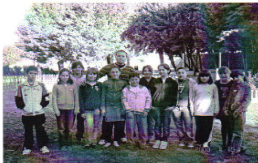
Miembros del Periódico escolar