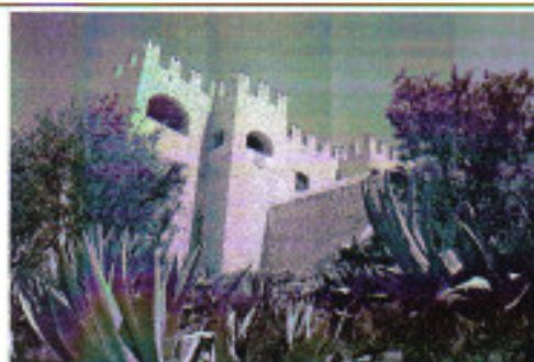
Castillo de Vélez Blanco en el norte de Almería.